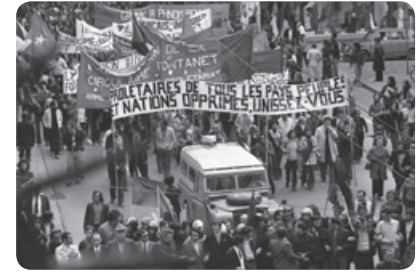
L'un des cortèges du 1 er mai 1973

Le 1 er mai 1886, 340 000 ouvriers américains organisent une grève générale pour obtenir la diminution de leur temps de travail, qui était alors de 10 heures par jour. La plupart des pays consacrent depuis cette date à la défense des droits des travailleurs . En France, la journée de 8h est accordée au printemps 1919 et le 1 er mai devient férié la même année. Et le muguet dans tout ça ? Ses clochettes très parfumées symbolisent la chance et le renouveau . En 1900, les grands couturiers parisiens récompensent toutes leurs employées en leur offrant un brin de muguet. Le muguet est depuis un incontournable du 1 er mai , tant pour sa portée symbolique que pour ses vertus porte-bonheur. Ce jour-là, tout le monde peut en vendre librement dans la rue !