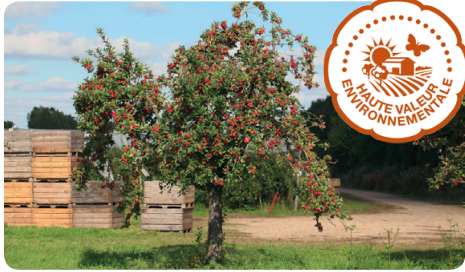
La famille Gautier cultive plus de 60 ha de pommiers