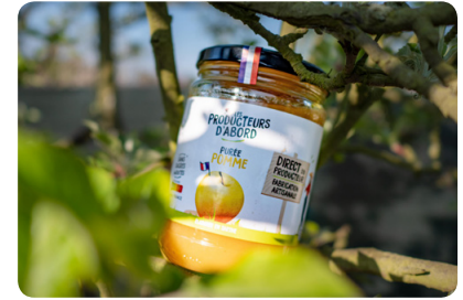
Leurs produits sont vendus aux collectivités et particuliers