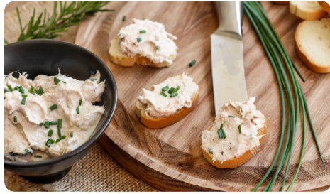
Les rillettes de poisson sont à la fois légères et très faciles à faire