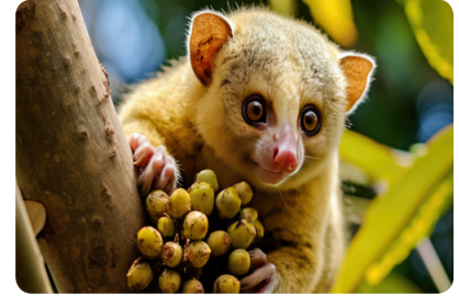
En Océanie, le couscous est un marsupial aux yeux rigolos

Le couscous est la star des spécialités nord africaine ! Initialement, le terme désignait seulement les grains de semoule de blé dur. En effet, le plat se composait uniquement de semoule cuite à la vapeur, agrémentée de beurre ou d'huile et de pois chiches. Aujourd'hui, cette base est le plus souvent servie avec un ragoût de légumes (courgettes, oignons, carottes, navets...) et de viande. Depuis 2020, le couscous est inscrit au patrimoine culturel immatériel de l'UNESCO. Traditionnellement, il se prépare avec une seule viande. Cependant, dans le couscous royal, volaille, mouton et merguez se mélangent, et on fait même aujourd'hui du couscous au poisson. Fait amusant, l'appellation couscous désigne aussi en zoologie... un marsupial d'Océanie !