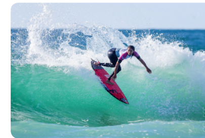
Vahine Fierro surfe les vagues tahitiennes depuis l'enfance

Cette semaine, le menu à thème nous embarque vers l' Océanie ! Côté saveurs, poisson et lait de coco seront au rendez-vous. Côté athlète, c'est la jeune championne de surf Vahine Fierro qui sera à l'honneur. Née en Polynésie française de parents eux-mêmes surfeurs, elle montait déjà sur la planche à 2 ans ! Dès son bac en poche, elle parcourt le monde pour faire des compétitions et remporte le championnat du monde junior en Australie. Sélectionnée en équipe de France depuis 2021, Vahine Fierro participe notamment aux World Surfing Games 2023 au Salvador et s'y qualifie pour les JO en étant classée meilleure surfeuse européenne . La jeune Française incarne la féménisation de sa discipline et sera aussi la première « locale » à surfer sur l'emblématique vague de Teahupoo !