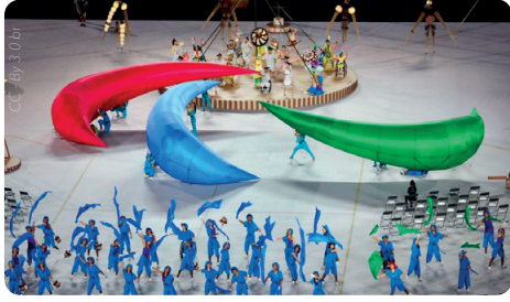
Le logo des « JP » s'est animé pour la parade de Tokyo 2020