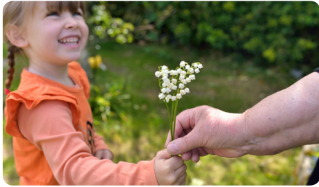
La tartiflette au reblochon de Savoie