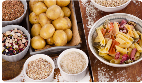
Apports en sucres lents : l'embaras du choix