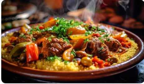
Le couscous traditionnel est un patrimoine à préserver