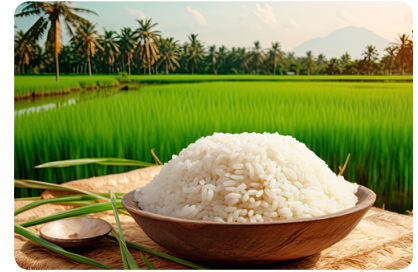
Le riz est la céréale la plus consommée dans le monde

Les céréales, féculents et légumes secs sont essentiels à l'équilibre alimentaire . Riches en fibres et en protéines, ils fournissent de l'énergie sur la durée , d'où leur appellation de sucres lents . En consommer à chaque repas évite les fringales et cela tombe bien : il existe assez de possibilités pour ne pas se lasser ! Par exemple, le Syrec commence la semaine avec un service de boullgour bio . Mardi, c'est le pain du croque-fromage qui apporte les glucides complexes, puis, mercredi, des pommes de terre . Enfin, la semaine se termine avec du riz bio jeudi, et des pâtes bio vendredi. Le riz est la céréale la plus consommée dans le monde avec environ 500 millions de tonnes par an , très loin devant les 17 millions de tonnes de pâtes alimentaires consommées !